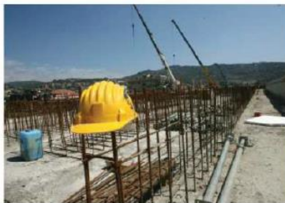
NEI CANTIERI NECESSARIA LA SICUREZZA

A questo scopo la Regione Siciliana si affida agli Organismi paritetici territoriali, che hanno le funzioni di divulgare le buone pratiche per la diminuzione dei rischi e di individuare soluzioni tecniche e organizzative per migliorare le situazioni esistenti. «Le novità riguardanti la convenzione sono, in primo luogo, l'assistenza e la consulenza tecnica, da parte dell'Organismo, anche al responsabile unico del procedimento (Rup), in modo da favorire l'attuazione corretta delle norme; in secondo